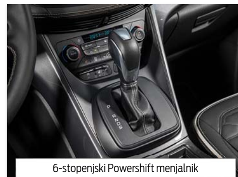
6-stopenjski Powershift menjalnik