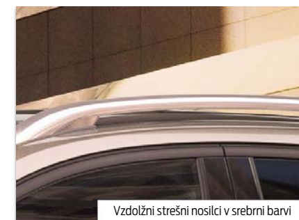
Vzdolžni strešni nosilci v srebrni barvi