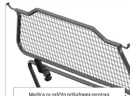
Mrežica za zaščito prtljažnega prostora