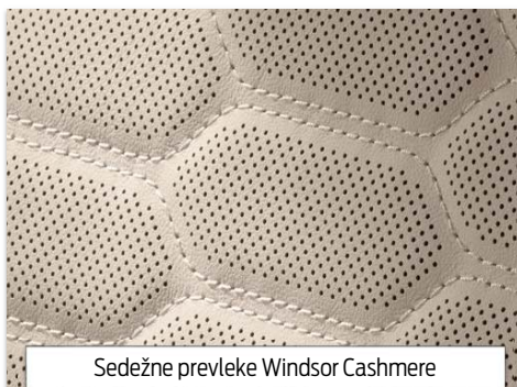
Sedežne prevleke Windsor Cashmere