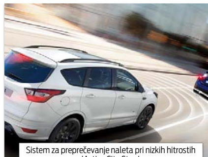
Sistem za preprečevanje naleta pri nizkih hitrostih 'Active City Stop'