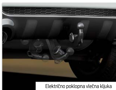
Električno poklopna vlečna kljuka