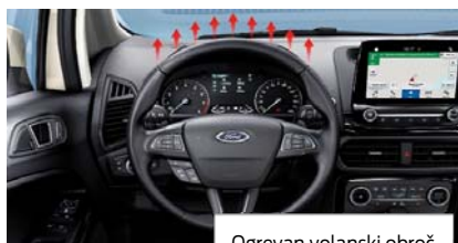
Ogrevan volanski obroč