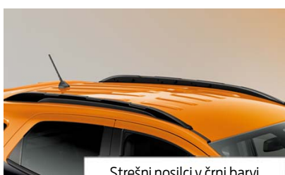
Strešni nosilci v črni barvi