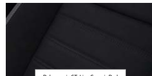
Delno usnje ST-Line Generic Red