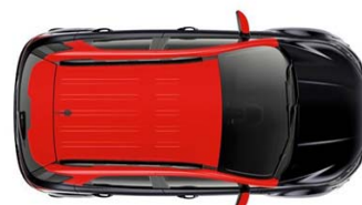
Race Red barva strehe