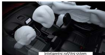
Inteligentni zaščitni sistem

Revolucionarni novi 1,0-litrski 3-valjni bencinski motor EcoBoost vam zagotavlja moč, ki bi jo sicer pričakovali od običajnega 1,6-litrskega motorja, pri tem pa dosega za 24 % manjšo porabo in za 25 % nižje izpuste CO2. Diamantu podobna prevleka na batnih obročkih zmanjšuje trenje; turbopolnilnik, neposredni vbrizg in spremenljiva časovna uskladitev ventilov pa izboljšujejo izkoristek. Rezultat je izjemno varčen motor, ki je že šest let zapored zmagovalac mednarodnih tekmoval