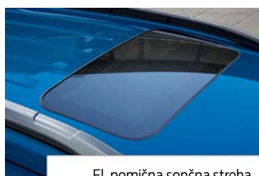
El. pomična sončna streha