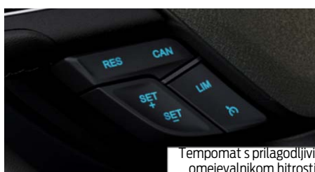
Tempomat s prilagodljivim omejevalnikom hitrosti