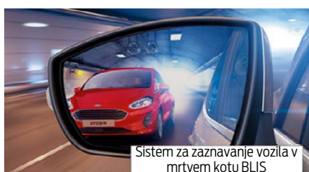
Sistem za zaznavanje vozila v mrtvem kotu BLIS