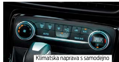
Klimatska naprava s samodejno regulacijo temperature