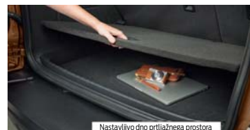
Nastavljivo dno prtljažnega prostora