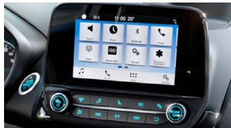
SYNC 3 in 6,5 " zaslon na dotik