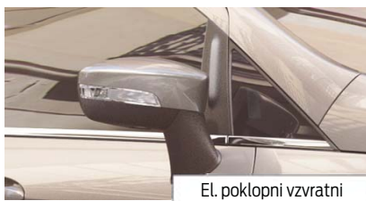
El. poklopni vzvratni ogledali