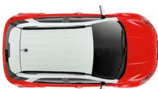
Frozen White barva strehe