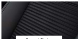
Delno usnje Titanium