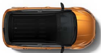
Absolute Black barva strehe

Opomba: v primeru, da je streha v kontrastni barvi, je v kontrastni barvi tudi ohišje zunanjih vzvratnih ogledal