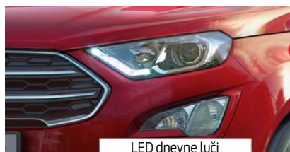
LED dnevne luči