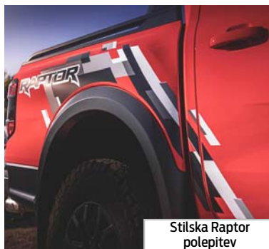
Stilska Raptor polepitev