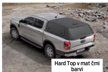
Hard Top v mat črni barvi