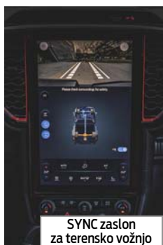
SYNC zaslon za terensko vožnjo