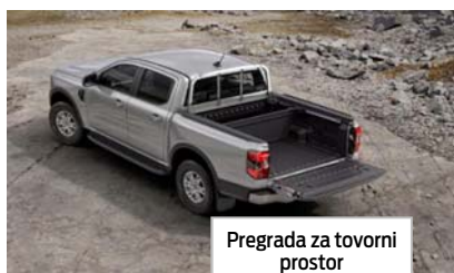
Pregrada za tovorni prostor